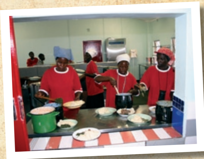
Keittiömme tarjoaa lämpimän aterian joka päivä

Maksamme lasten puolesta koulumaksut, koulupuvut ja muut tarvikkeet, päivittäisen aterian, urheiluvarusteet ja terveydenhoitokulut. Ohjelmassamme on noin 400 orpolasta kaupungin osan eri peruskouluissa. Lisäksi on joitakin lapsia yliopistossa tai muussa kolmannen asteen koulutuksessa.