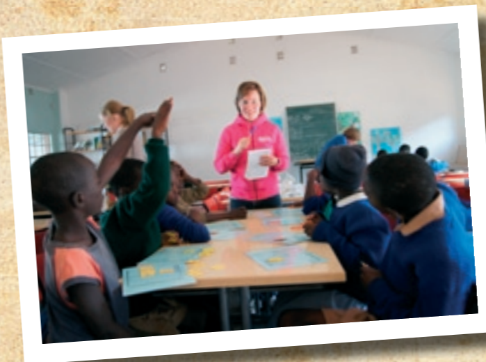
Suomalainen opettaja antamassa tukiopetusta

Dzivarasekwassa on seitsemän julkista ala-asteen koulua ja kaksi valtion yläastetta/lukiota. Koulun jälkeen pyrimme ohjaamaan nuoret jatko-opintoihin tai työelämään