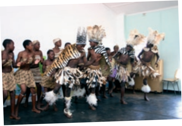
Lasten tanssiryhmä esiintyy