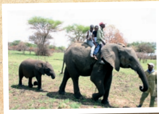
Lapset Imiren safaripuistossa

voimassa 21.6.2011 – 30.4.2013 koko Suomen alueella Ahvenanmaata lukuun ottamatta